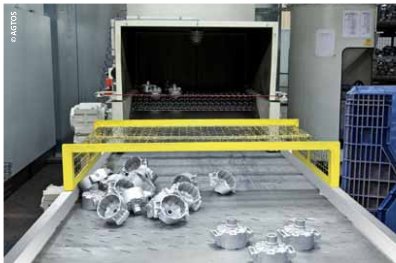
AGTOS-Wire mesh conveyor shot blast machine, Type BS. Granigliatrice con trasportatore a rete metallica AGTOS, tipo BS.